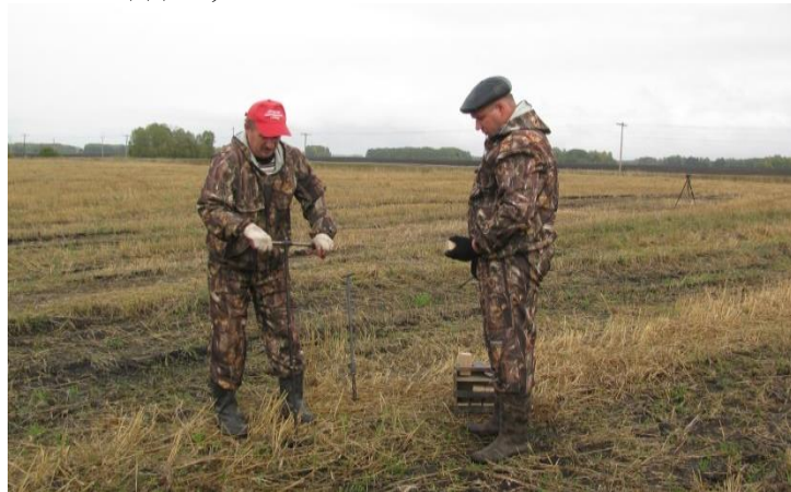
ФГБУ САС «Томская»

проведен комплексный мониторинг плодородия почв земель сельскохозяйственного назначения – обследовано 50 тыс. га. В мониторинг вошли земли Зырянского района на площади 30 тыс. га. и Первомайского – на площади 20 тыс. га. Так же в рамках хозяйственной деятельности, выполнена работа по подготовке проектно-сметной документации на выполнение культуртехнических работ, в рамках государственной программы эффективного вовлечения в оборот земель сельскохозяйственного назначения, на площади 5,5 тыс. га.