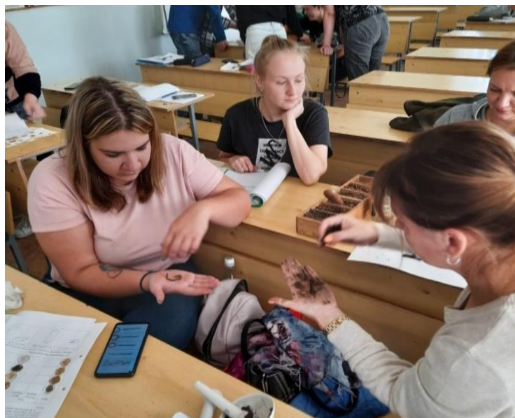
ФГБУ ЦАС «Белогорский»

По итогам обучения специалисты получили удостоверение о повышении квалификации по дополнительной профессиональной программе «Методы почвенных и геоботанических исследований» в объеме 72 часа.