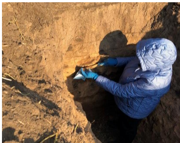
ФГБУ «САС «Альметьевская»

Специалистами ФГБУ «САС «Альметьевская» в период после завершения агрохимического обследования земель сельскохозяйственного назначения проведена закладка четырех почвенных разрезов на основных типах почв Закамской зоны РТ – черноземе выщелоченном и черноземе типичном. Почвенные разрезы заложены в Альметьевском и Бугульминском районах в местах детального изучения черноземов РТ в послевоенный период предыдущими исследователями. по тем же координатам с целью изучения антропогенного влияния на состояние черноземов Закамья РТ в том числе органического вещества как интегрального показателя почвенного плодородия за 65-летний период.