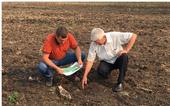
ФГБУ САС «Шадринская»

В целях реализации задач сохранения и восстановления плодородия почв земель сельскохозяйственного назначения в Курганской области было проведено агрохимическое, эколого-токсикологическое и радиологическое обследование земель 12 хозяйств Далматовского района на площади 100,4 тыс. га. Совместно с представителями Администрации Шадринского района провели приемку 5 участков пашни, площадью 400 га, введенных в оборот по программе «Эффективного вовлечения в оборот земель сельскохозяйственного назначения и развития мелиоративного комплекса РФ»